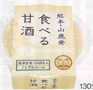
130グラム、350円。別途箱詰めのご贈答あり